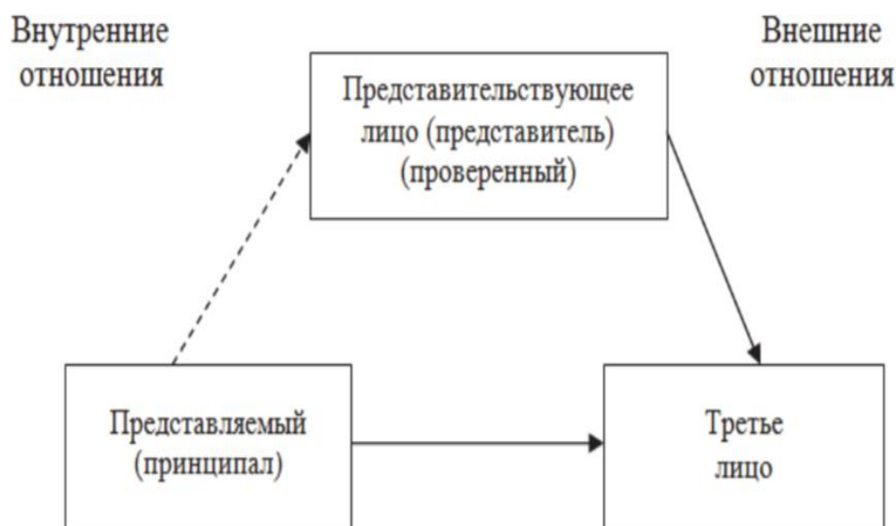
Рис. 2. Схема отношений принципала, представителя и третьего лица по доверенности на представительство: – заключение коммерческой сделки; – доверенность для представительства

Другой формой правовых отношений в транспортной экспедиции является представительство (гл. 10 ГК РФ), основанное на доверенности. Доверенностью является письменное уполномочие, выдаваемое физическим или юридическим лицом, представляемым (принципалом) физическому или юридическому лицу – представителю для представительства перед третьими лицами. На рис. 2. представлена схема отношений участников по договору представительства.