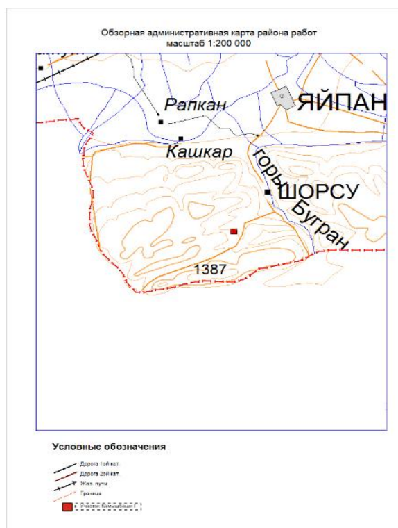
Рис. 3 Обзорно-административная карта района

В подошве гипсовой толщи залегают глины верхнемелового возраста коричневатых, бурых, зеленоватых и серых оттенков с прослоями гипса общей мощностью до 50 м. В кровле толщи отмечаются сланцеватые глины зеленовато-серого цвета и пески палеогенового возраста (бухарский ярус) мощностью около 15 м.