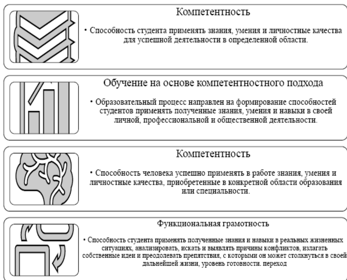
Рис. 1. Этапы формирования функциональной грамотности

На основе анализа литературы и практических наблюдений сделан вывод, что функциональная грамотность формируется в образовательном процессе на основе компетентностного подхода. (рис. 1.)